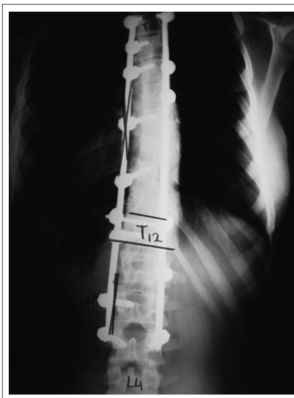
Figura 2 – Radiografia no plano frontal pós-operatória com ângulo de Cobb na curva torácica principal de 9°.

Esses resultados refletem uma melhora de um grau na Classificação de Nash e Moe 12 presente em 11 (52,38%) pacientes do estudo. Nos demais 10 pacientes (47,62%), não houve alteração do grau de rotação pré e pós-operatório de acordo com a Classificação de Nash e Moe 12 . Em nenhum caso houve piora da rotação após o tratamento cirúrgico com material de terceira geração (Tabela IV).